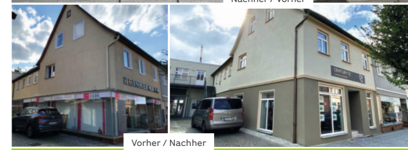
Vorher / Nachher