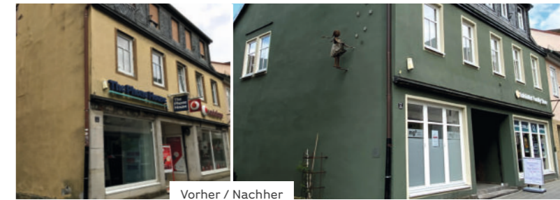
Vorher / Nachher