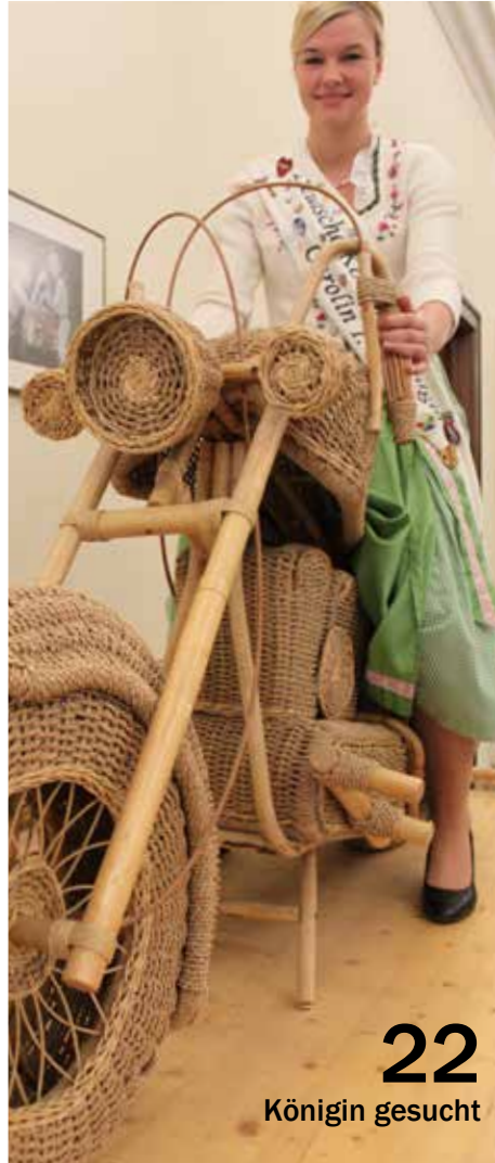
22 Königin gesucht