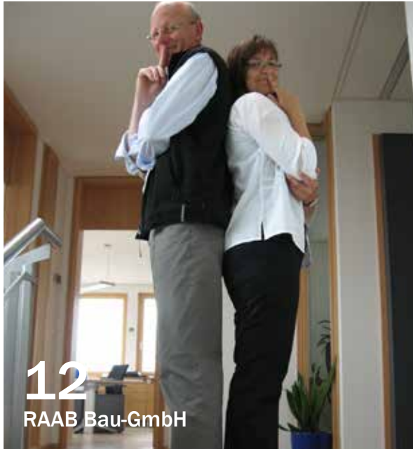
12 RAAB Bau-GmbH