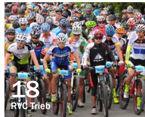
18 RVC Trieb

6 Unternehmensvorstellung: Aviationscouts