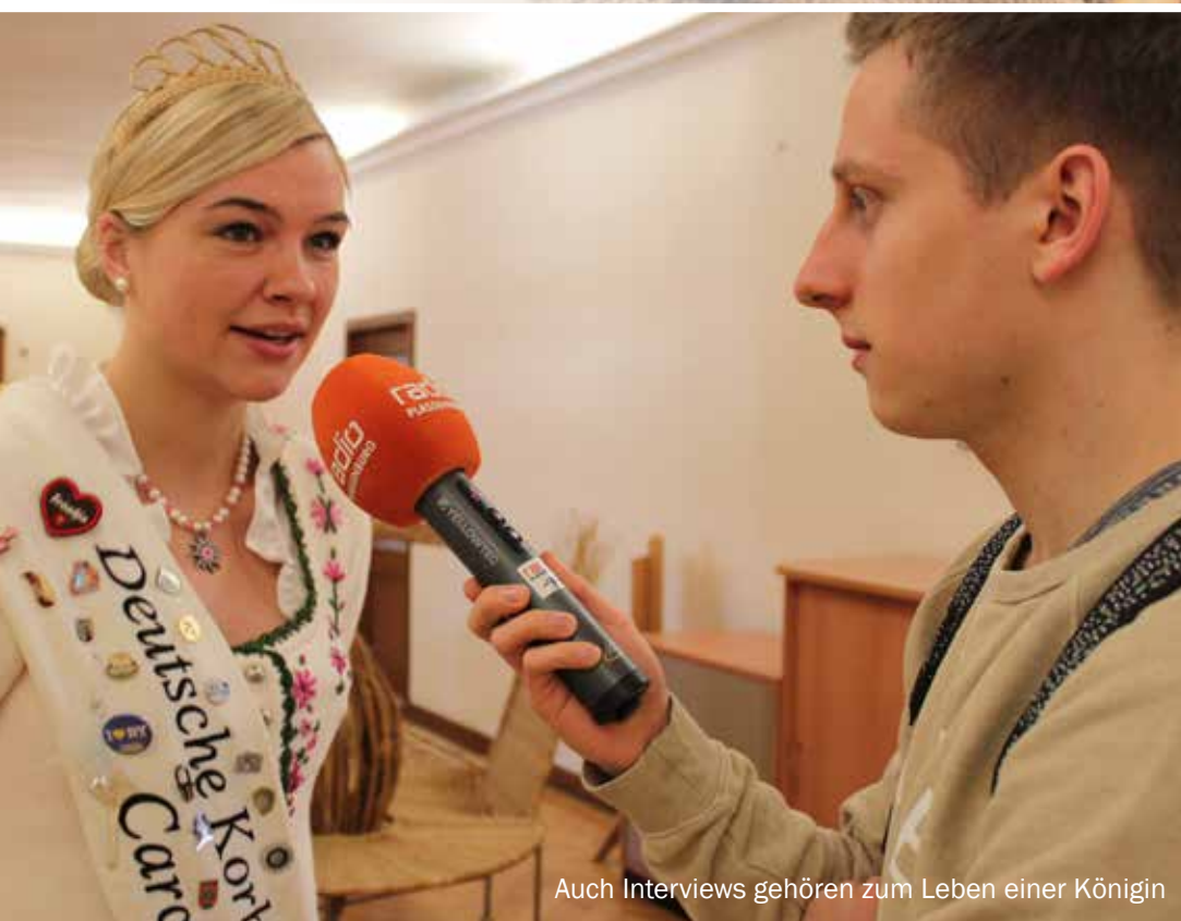
Auch Interviews gehören zum Leben einer Königin

Informationen unter: Tel. 795-101 www.lichtenfels-city.de